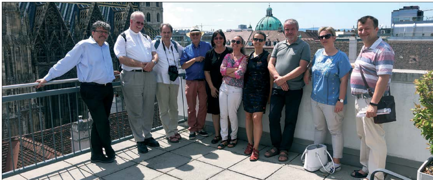
Loňské setkání ve Vídni v rámci mezinárodního projektu Erasmus+, zaměřeného na problematiku migrace