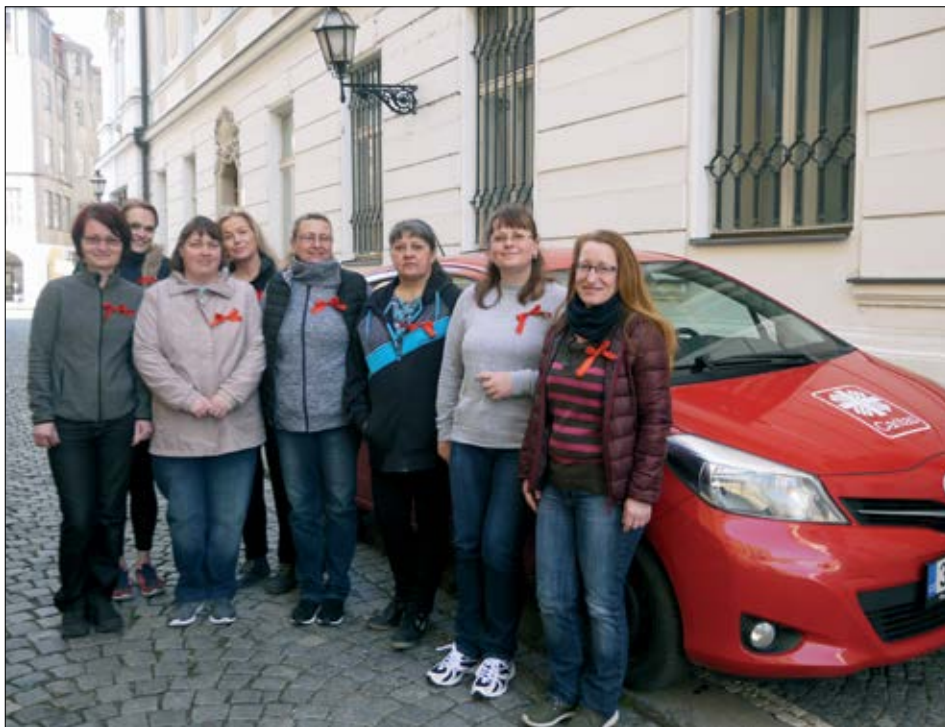
Ke stávkové pohotovosti se připojily také sestry v hradecké domácí péči.

Nutno podotknout, že mzdy našich sester se generují z úhrad od zdravotních pojišťoven, které značně ušetří už na tom, že