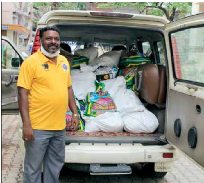
◀ Distribuce potravinové pomoci indickým rodinám, které postihla koronakrize. Děkujeme všem, kdo přispěli do veřejné sbírky!