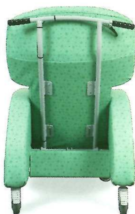
Možnost nastavení výšky zádové opěrky do dvou pozic