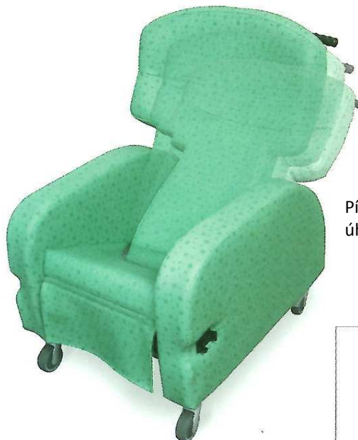
Pístový mechanismus, nastavitelný úhel sedu