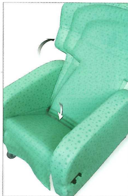
Pevná přední hrana sedáku udržuje při jeho sklopení kolena ve správné výšce