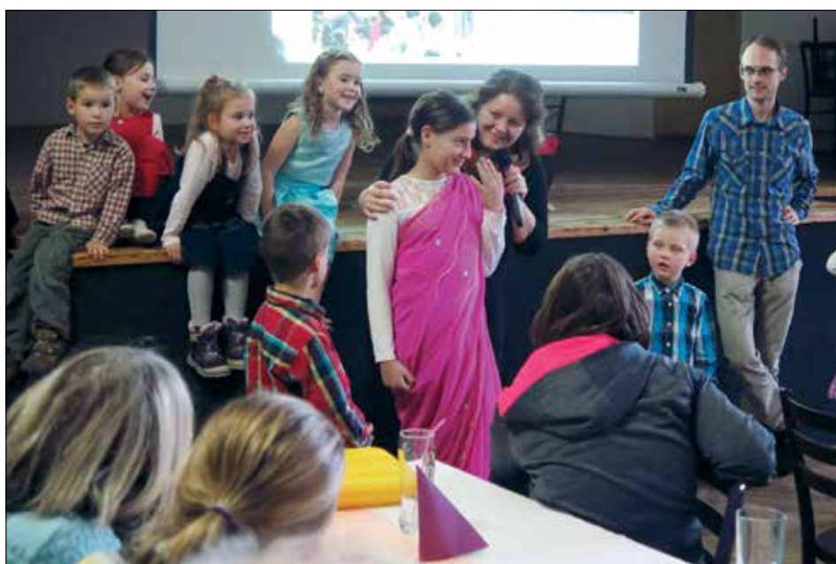
(Povídání o Adopci na dálku a o Indii na loňském farním dnu v Letohradě. Foto: Iva Marková)