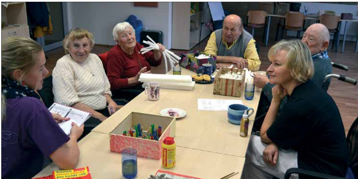
☛ Klienti Petrklíče také vyrábějí rozmanité dekorace v rámci oblíbené tvůrčí dílničky anebo trénují paměť.