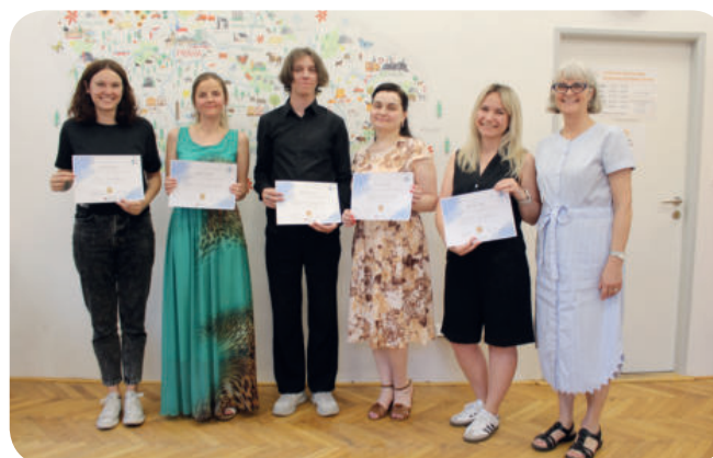
Foto: Vítězové literární soutěže pro absolventy kurzů češtiny, kterou před prázdninami uspořádalo Integrační centrum pro cizince DCH HK. Jejich příběhy byly prezentovány i na Setkání národů. (z archivu)

Posláním centra je podpora integrace cizinců ze třetích zemí i zemí EU a osob s udělenou mezinárodní ochranou na území Královéhradeckého kraje do většinové společnosti. Projekt je financován z prostředků Azylového, migračního a integračního fondu a rozpočtu Ministerstva vnitra ČR.