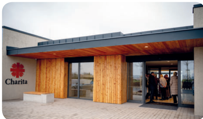
Foto: Slavnostní otevření 1. a 2. etapy Centra sociálních služeb v Holicích, které zásadně rozšířilo možnosti podpory pečujícím rodinám na Holicku, Pardubicku i v širším okolí.