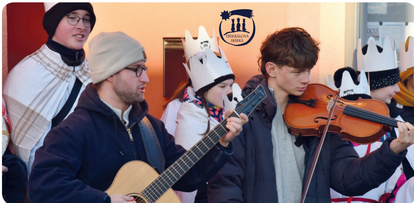
Foto: Ve Vysoké nad Labem si tři králové zazpívali také s oblíbeným písničkářem Michalem Horákem, který složil a nazpíval úspěšnou kolednickou hymnu k 25. výročí Tříkrálové sbírky.

V roce 2025 se uskutečnil jubilejní 25. ročník Tříkrálové sbírky, jejímž pořadatelem je Charita Česká republika. Sběrka úspěšně propojuje různé generace a nabízí široké veřejnosti příležitost aktivně se podílet na charitní pomoci. Na území královéhradecké diecéze se poprvé zapečetilo více než 5 000 pokladniček, do nichž dárči přispěli téměř 29 milionů korun.