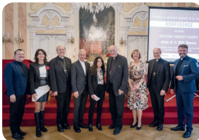
Foto: Mezinárodní konference v Olomouci u příležitosti 36. výročí svatořečení Anežky České.

V listopadu 12. 11. institut zorganizoval také mezinárodní konferenci na téma „Rozvíjíme hodnoty Charity“ v Olomouci , která se konala pod záštitou prezidenta Charity ČR Mons. Pavla Posáda a světícího biskupa olomouckého Mons. Antonína Baslera. Významným hostem byl také prezident Caritas Europe P. Michael Landau. Hlavními tématy byly Kodex Charity ČR, role Charity v evropském kontextu a inspirace hodnotami sv. Anežky České. Konference se zúčastnilo 170 účastníků z ČR a Slovenska.