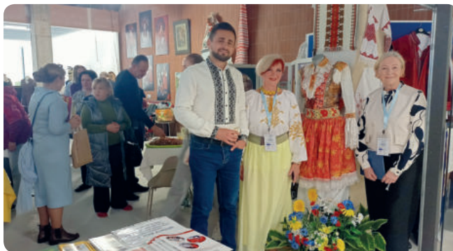
Foto: Ukrajinské dny 2025 s podtitulem Mosty kultury nabídly bohatou přehlídku tradic a umění v OC Atrium (z archivu).